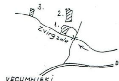
ZEMES IZVIETOJUMA SHĒMA