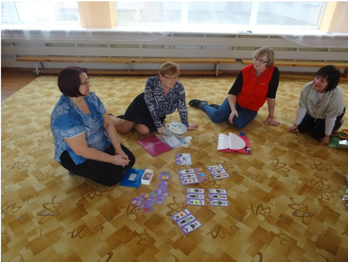
3.7.1. 1.attēls Pedagogu ideju tirdziņš 2018.gadā